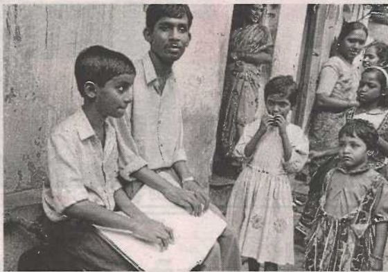
Niños leyendo en braille en Bombay.