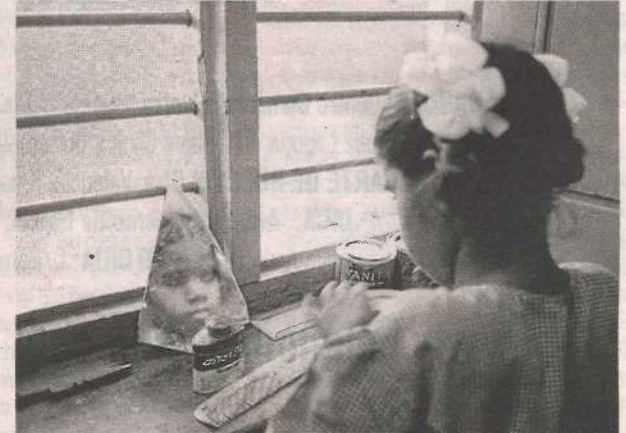
Si falta la visión, faltan modelos que imitar. T.D.