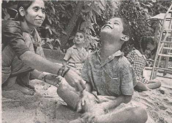
Despertando el gusto por palpar y conocer. F.M.