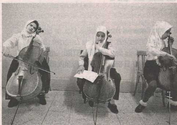
La formación musical integra socialmente. F.M.